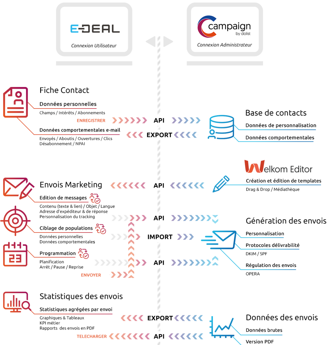
Schéma des ponts techniques réalisés entre le CRM E-Deal et la plateforme Campaign